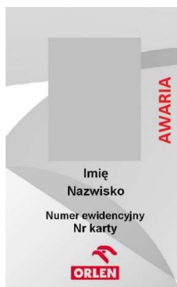
Karta dla pracownika ORLEN S.A